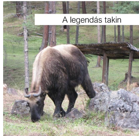
A legendás takin

A 780 ezer bhutáni megközelítőleg fél magyarországnyi, nagyon eltérő magasságú és klímájú területen él, és közel húsz nyelven beszél. Az Ázsiában szokatlanul gyéren lakott ország 70%-át erdő borítja, amely olyan